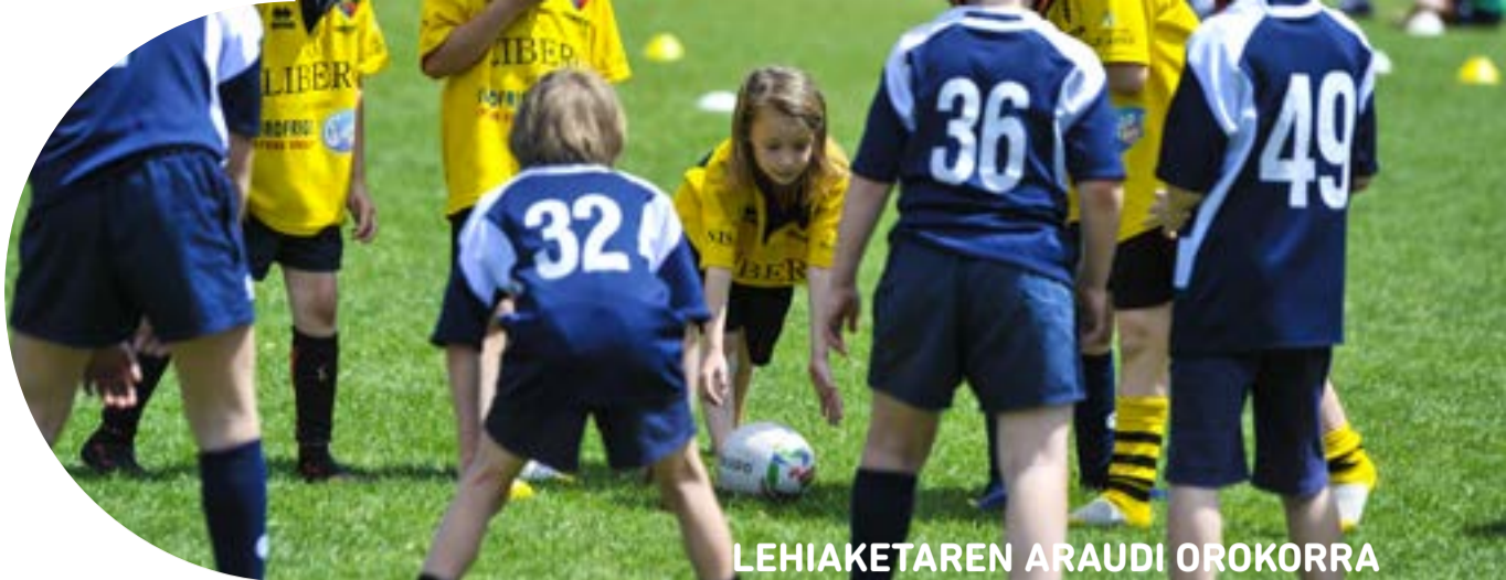
LEHIAKETAREN ARAUDI OROKORRA