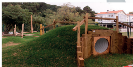
Orioko Zaragueta Herri Eskolako patioak irudia aldatuz hasi du ikasturtea