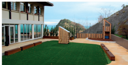
Jolastoki berria aurkeztu du Getariako Iturzaeta Herri Eskolak