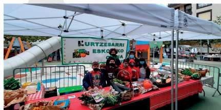
Kurtzebarri Eskolak produktu ekologikoen postua jarri du Aretxabaletako azoka txikian