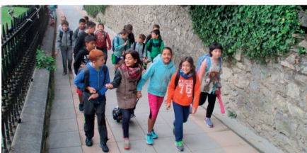
"Eskolara oinez" proiektua Arrasateko Herri Eskolara itzuli da