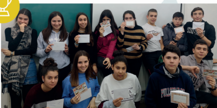
Ordiziako Oianguren BHIk kalitateko zigilu europarra lortu du eTwinning proiektuarekin