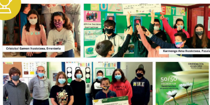
50/50 proiektuak Oarsoaldeko 6 ikastetxe saritu ditu eraginkortasun energetikoari laguntzeagatik