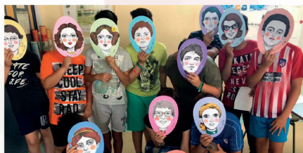
Nesken bokazio zientifiko-teknologikoa sustatzen duen proiektu aitzindaria