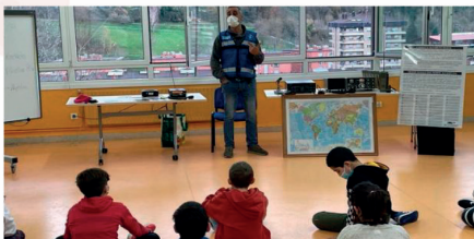
Errusiarekin irratiharremanak Elgoibarko Herri Eskolatik