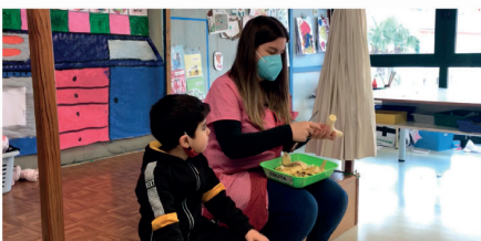
Hamaiketakoa orekatuz Ordiziko Urdaneta eskolan