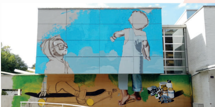
Street artea iritsi da Fleming Herri Eskolara