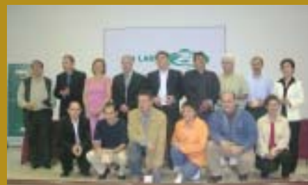
LARRAÑA - Oñati