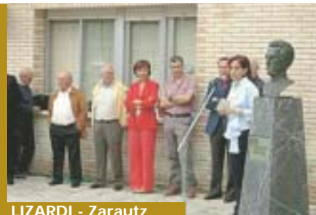
LIZARDI - Zarautz