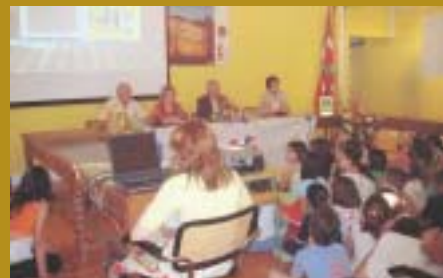
Murumendi - Beasain