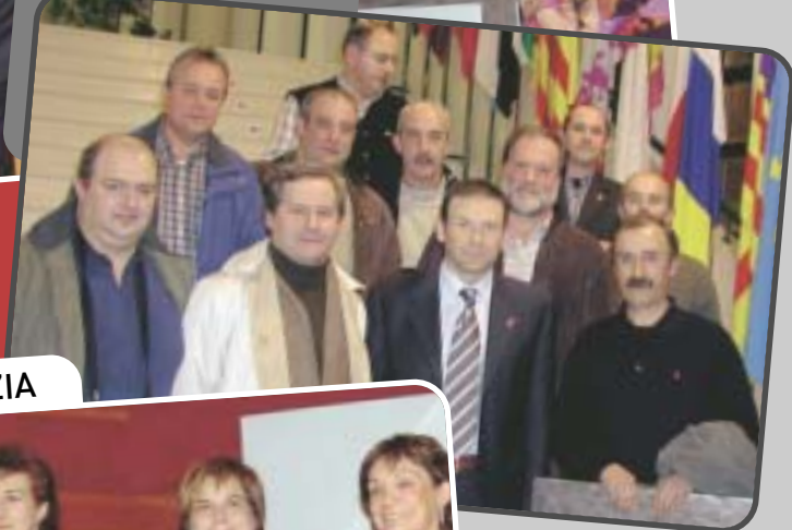
Zuazola - OÑATI