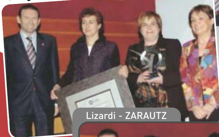
Lizardi - ZARAUTZ