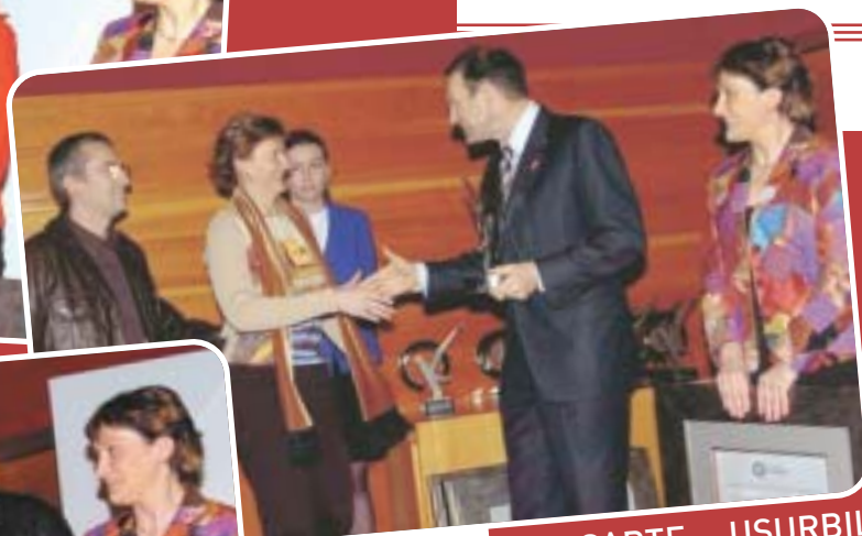
LASARTE - USURBIL