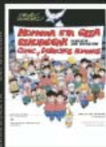
EXPOSICIÓN SOBRE EL "CÓMIC Y DERECHOS HUMANOS"

Todo ello completado con sesiones matinales dirigidas a la juventud y la infancia, una exposición sobre el "Cómics y Derechos Humanos" en la Biblioteca Municipal y el espectáculo de danza "Bihotzetik" del grupo Verdini, de personas afectadas por síndrome de Down. ☘