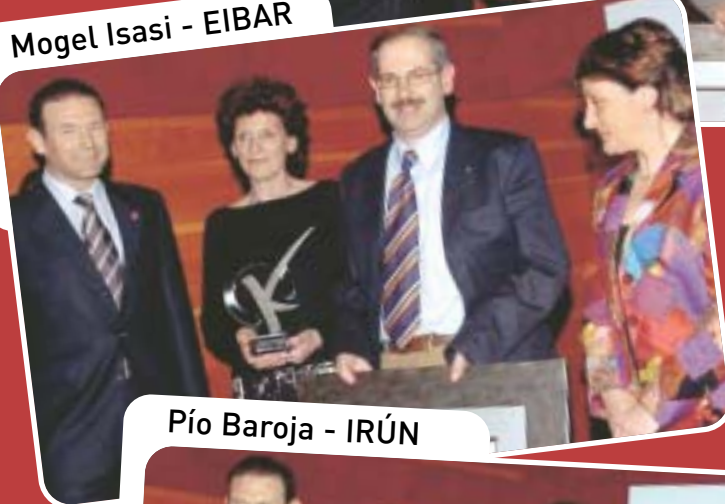
Pío Baroja - IRÚN