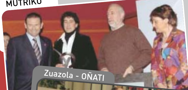
Zuazola - OÑATI