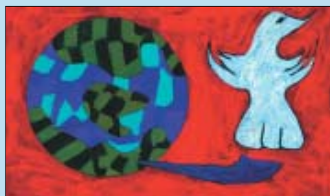
1. SARIA 13-16 urte