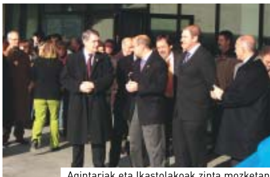
Agintariak eta Ikastolakoak zinta mozketan