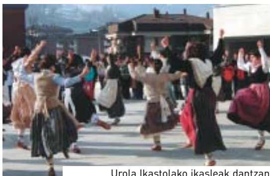
Urola Ikastolako ikasleak dantzan