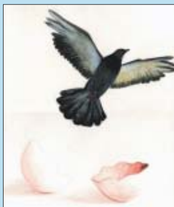
1. SARIA 9-12 urte