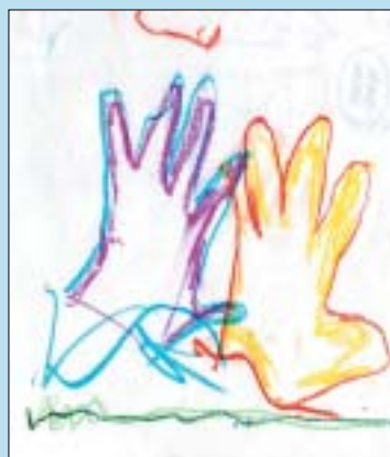
AKZESITA 6-8 urte