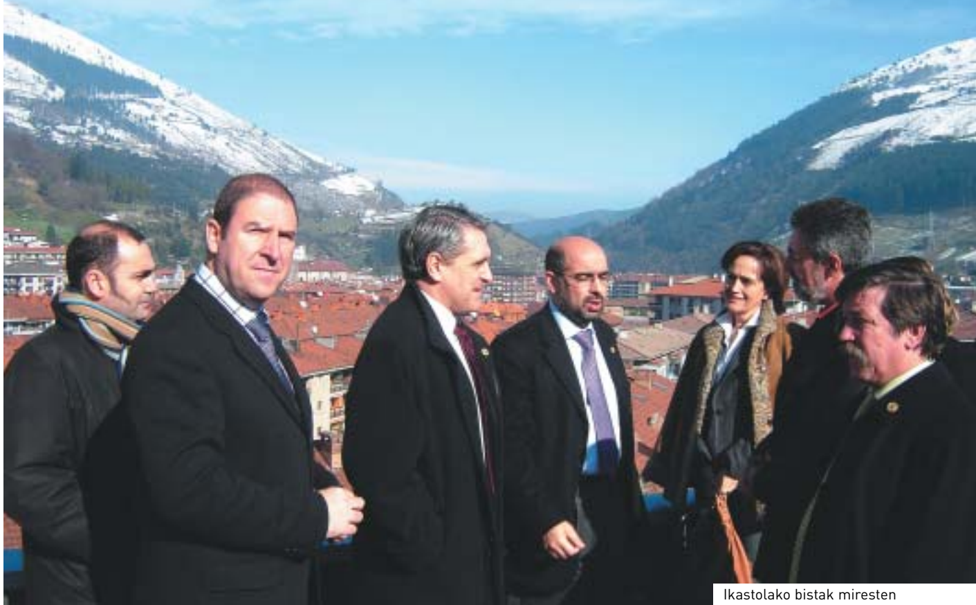
Ikastolako bistak miresten