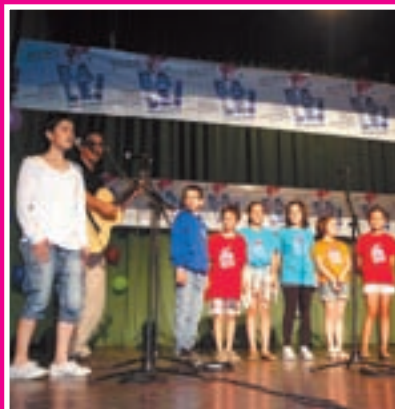
EUSKAL ESKOLA PUBLIKOAREN 21. JAIA