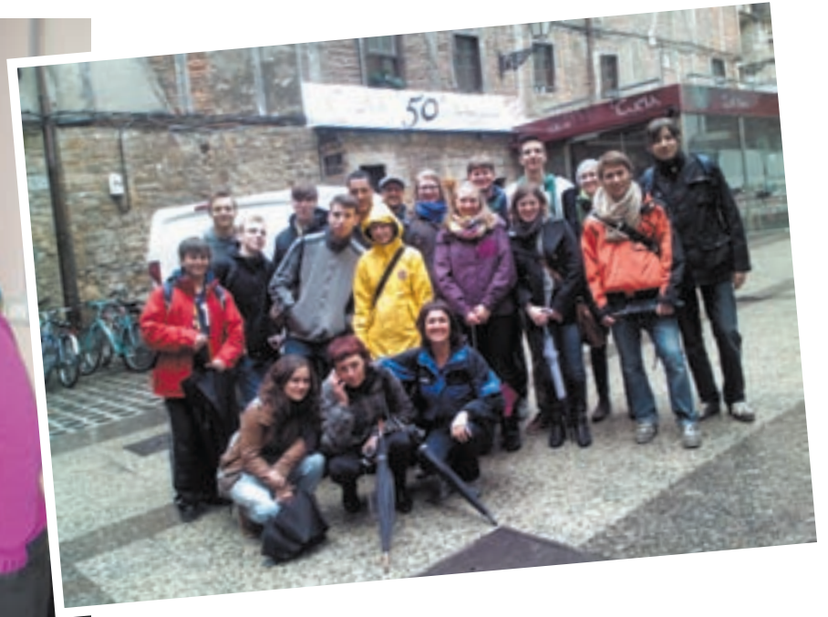
El instituto Leizaran, de Andoain, espera consolidar las relaciones con los centros de Alemania y Polonia de cara al futuro. En las diferentes imágenes se puede apreciar a los alumnos y alumnas de los centros en diversos momentos del intercambio.