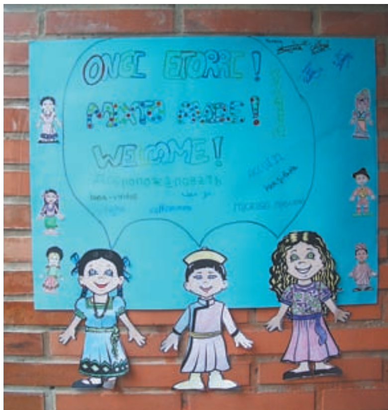
Un cartel daba la bienvenida a los asistentes.

Como todos los años, acompañada de la primavera, llegó la Semana de la Multiculturalidad al colegio Dunboa de Irun