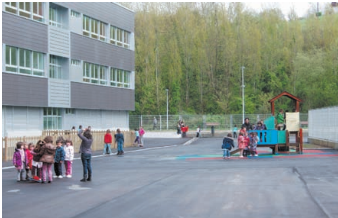
Irungo Eguzkitza eskolak eraikin propioa inauguratu du eta nabarmen hazi dira matrikulazio datuak.

ideiak laister entzuten hasi ziren: ez zela egingo, beste eskola batera bidaliko gintuztela, eraikina gehiago atze-