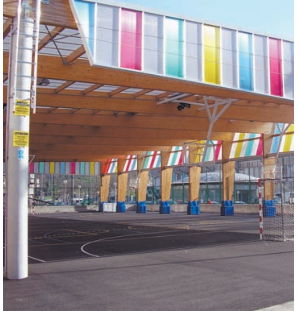
Berrikuntza lanak egiteko asmoa du udalak. Milioi bat euro eta erdi bideratuko ditu zeregin horretara.