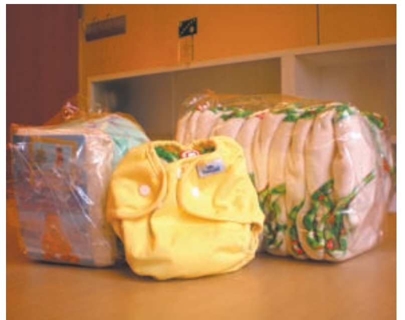
Telazko pixoihal berrerabilgarriak sustatu nahi dira Donostian.

-EZ DIRA HIGIENIKOAK (GEZURRA): Xurgatzailea temperatura altuetan garbituz gero, 60°C-an edo tenperatura altuagoetan, egon daitezkeen patogenoak erabat desinfektatzen direla bermatzen da. Hala ere, etxe-