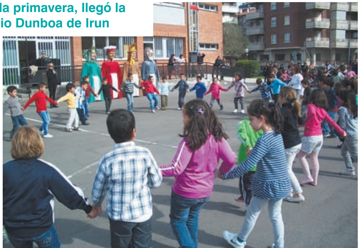
La participación de los alumnos y alumnas en todas las actividades fue, como otros años, multitudinaria.

→ Las responsables de la Asociación Kale Dor Kayiko que participan