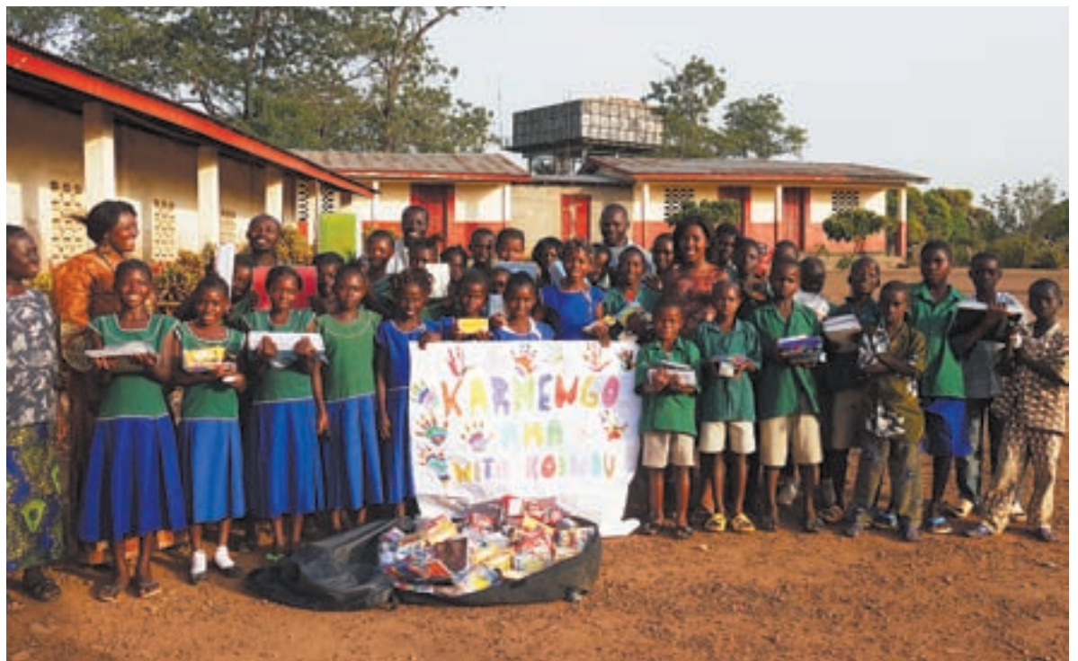
Alumnado y profesorado del colegio Koindu muestran los objetos llegados desde Euskadi. Arriba, una clase.

La familia de Sierra Leona en navidades estuvo en Koindu para hacer entrega a los responsables del centro del material enviado. Por parte de Karmengo Ama, la anterior semana se hizo una exposición en el salón de la tenencia de alcaldía de Trintxerpe con las fotos realizadas en Sierra Leona junto con el montaje en Powerpoint hecho por los/as alumnos/as de 6º, con el fin de abrirlo al pueblo.