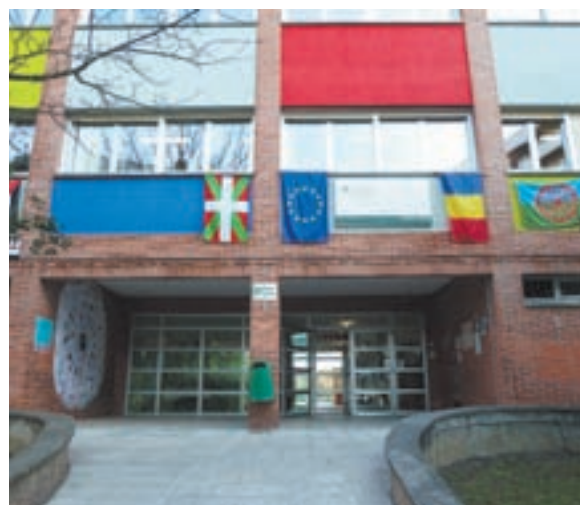
Diferentes banderas en la fachada del colegio. A la derecha, una actividad de kapeira.