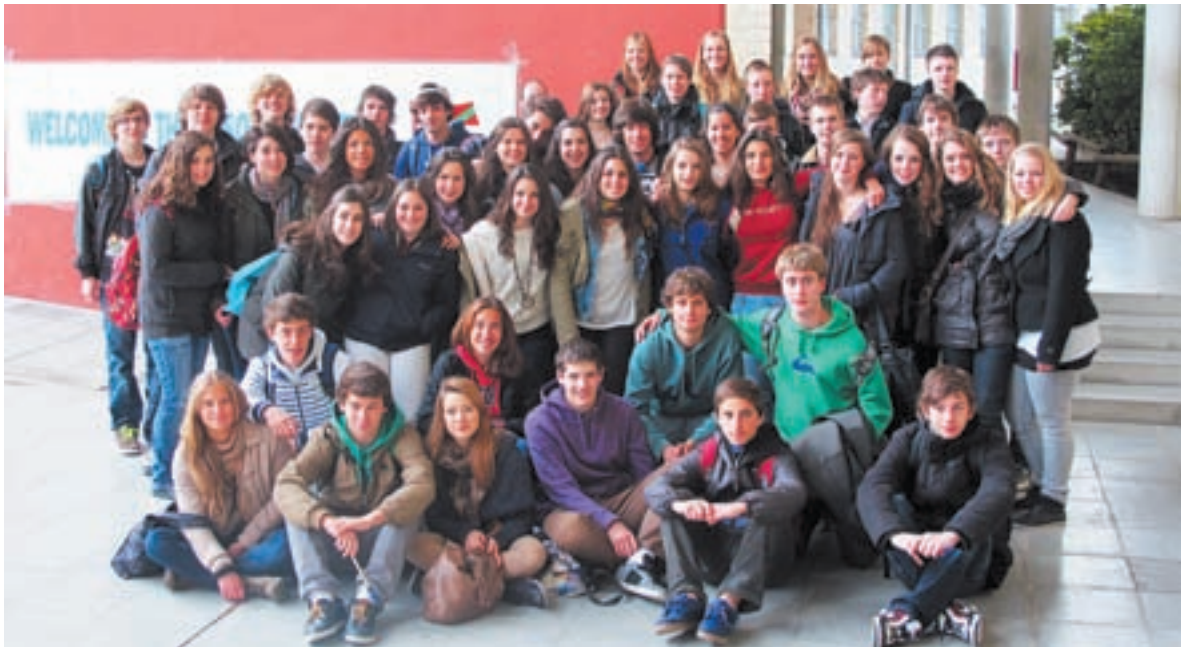
Txingudi BHI ikastetxeko ikasleak astebete joan dira Holandara eta handik ere Euskal Herrira etorri dira.