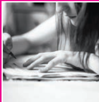
LAS ALTAS CAPACIDADES A EXAMEN EN LAS AULAS