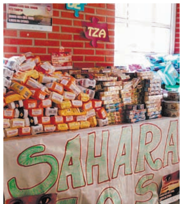
Hain beharrezkoak diren elikagaiak bidaliko dituzte aurten ere Saharara elkartasunaren karabana honi esker.