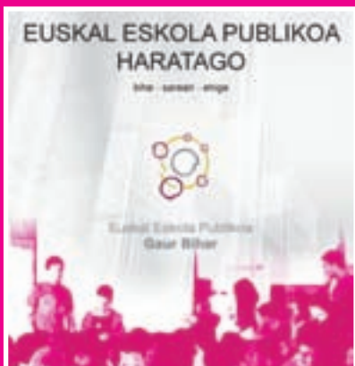
EUSKAL ESKOLA PUBLIKOA HARATAGO