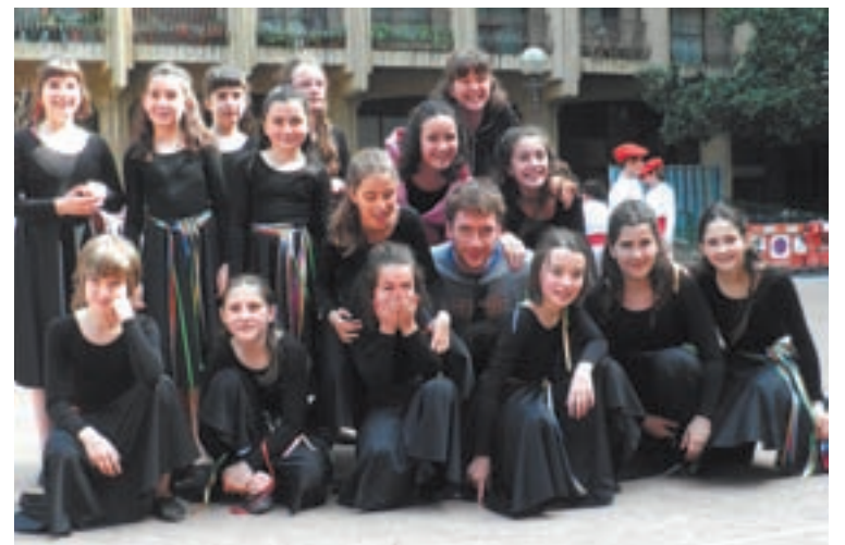
Taldeko dantzariak Donostiako Gros auzoko Txofre plazan egindako argazkian.

Dantzak itzelezko protagonismoa hartu du, azkenaldian, Zuhaitzin.