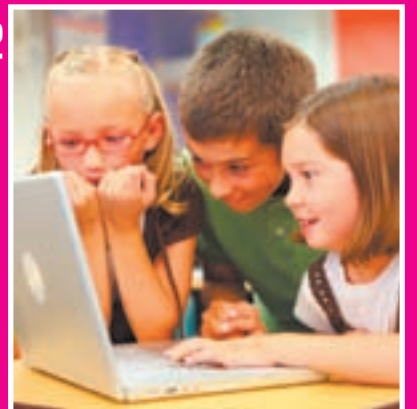
ETXERAKO LANAK BAI ALA EZ?