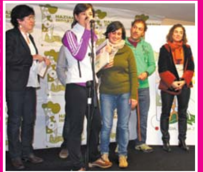
III CONCURSO DE BUENAS PRÁCTICAS DE AMPAS