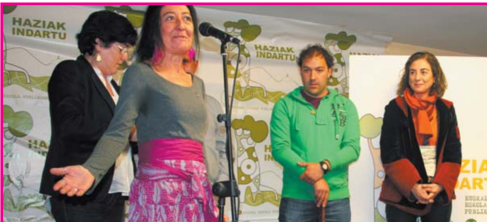
ACCESITA. Allende Salazar Guraso Elkarteak (Allende Salazar LHI, Gernika): "Elikadura osasunt-sua gure eskolan".