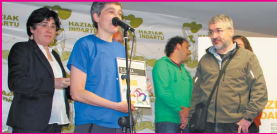
2. SARIA. Kanpandegi Guraso Elkarteak (Orixe ikastola, Donostia): "Denok goaz itsasontzi berean".