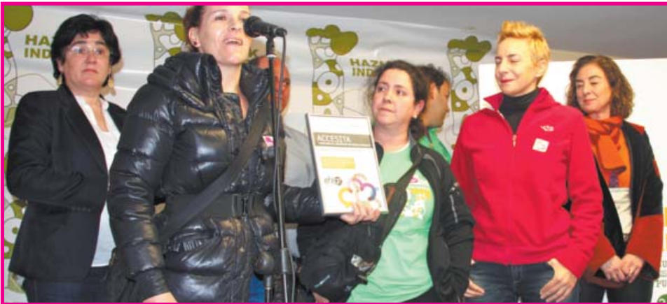
ACCESITA. Zabalarra Guraso Elkarteak (Zabalarra LHI, Durango): "Zabalarra: el corazón de una escuela pública".