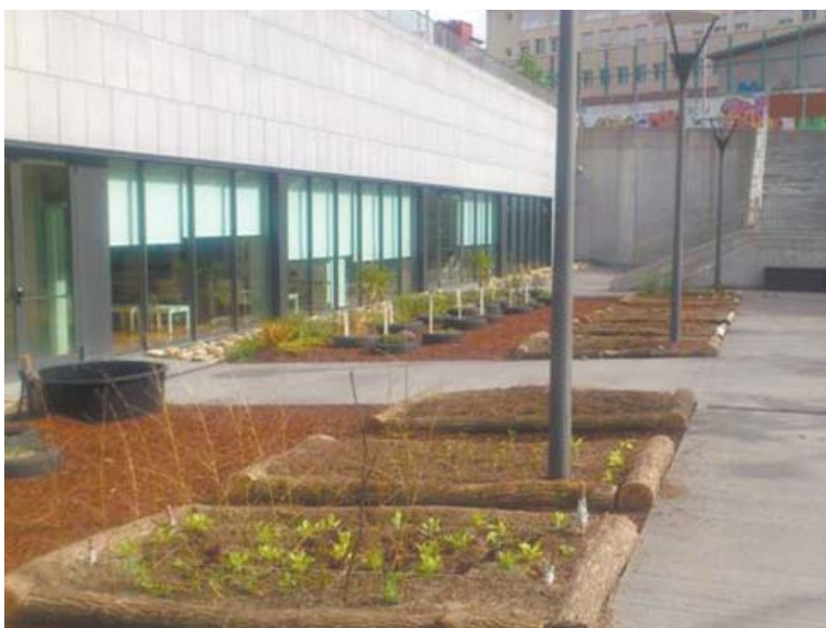
El objetivo es concienciar de la importancia de una dieta equilibrada y sostenible con su entorno.

Comer es imprescindible para vivir, pero también comemos para obtener placer, por aburrimiento, para calmarnos, para no pensar, para reunirnos con amigos y familia, para celebrar, para seducir. Y vivimos rodeados de estímulos que incitan a comer: programas de TV, publicidades, restaurantes, bares, kioscos y comercios con góndolas rebosantes de alimentos y bebidas, al alcance de