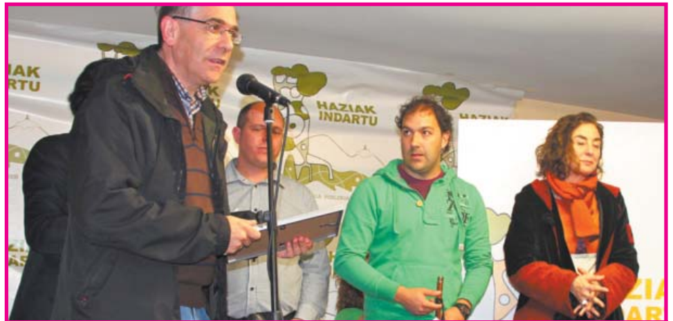
ACCESITA. Buruzpe Guraso Elkarteak (Sasoeta-Zumaburu LHI, Lasarte-Oria): "Markak hausten, euskera indartzen".