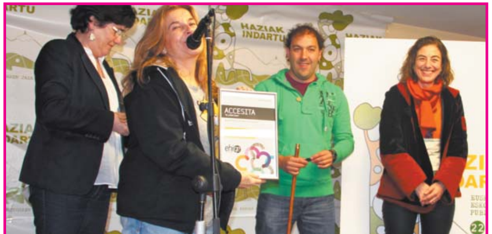
ACCESITA. Mungia BHIko Guraso Elkarteak (Mungia BHI): "Elurretara".