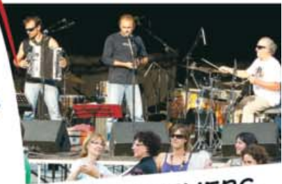
JEUX • ATELIERS