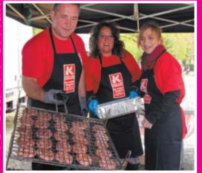
EUSKAL ESKOLA PUBLIKOAREN JAIA