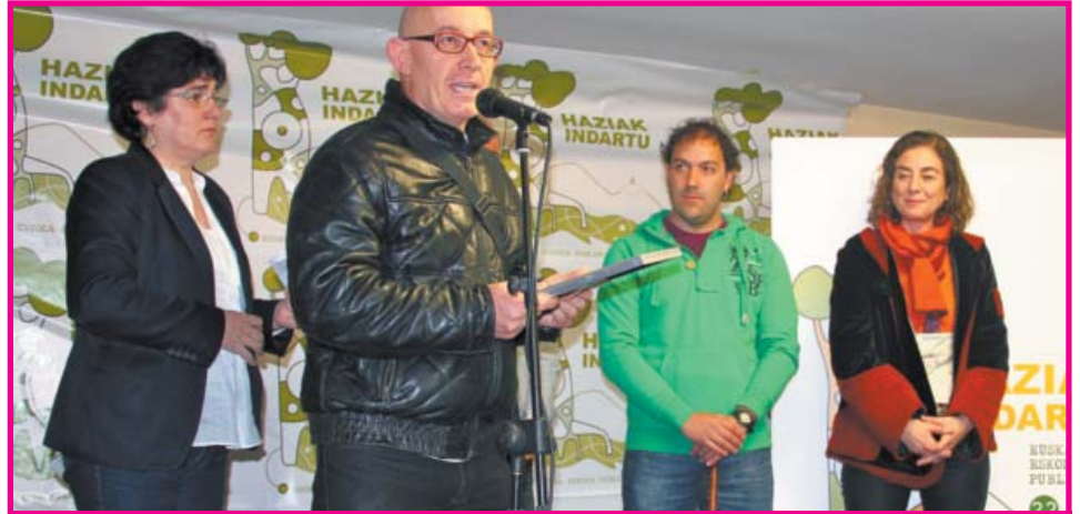
3. SARIA. Arantzabela Guraso Elkarteak (Arantzabela LHI, Gasteiz).