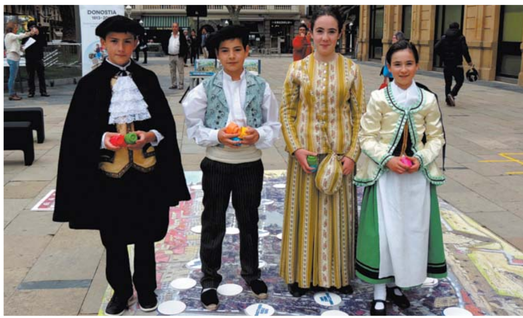
Orixeko ikastolako ikasleak.

Bigarren Mendeurrena dela eta sortutako mahai jolas kooperatiboa; elkartasunean eta talde ahaleaginean oinarritzen da