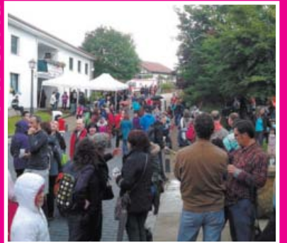
GIPUZKOAKO ESKOLA TXIKIEN JAIA