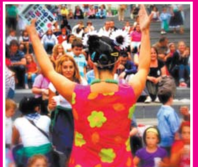
IPARRALDEKO ESKOLA ELEBIDUNEN BESTA SARAN