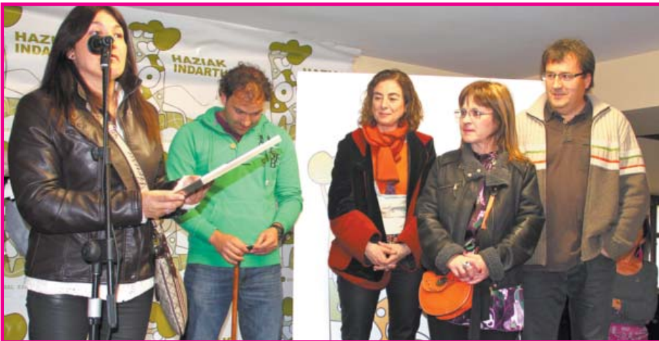
SARI BEREZIA. Minas BHI: "Café con familias. Elkarbizitarako elkagunea".