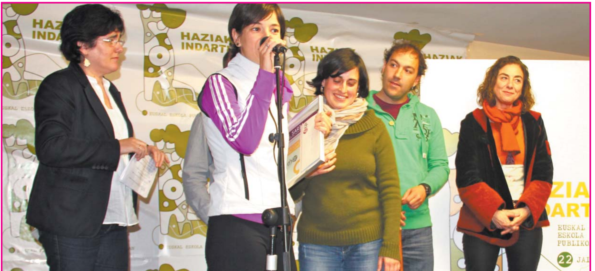
1. SARIA. Kalamua Guraso Elkarte (Elgoibar LHI): "Urtantak. Poliki-poliki blai egiten".