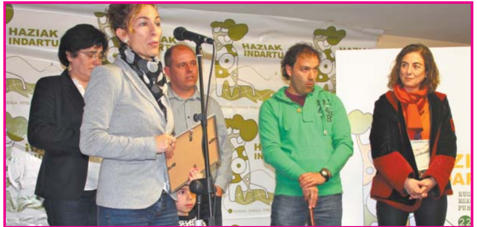
ACCESITA. Basarte Guraso Elkarteak (Zerain LHI): "Zeraingo haurren baratza ekologikoa".