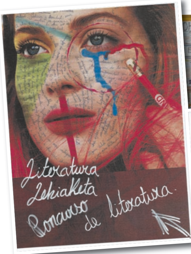
Kartel lehiaketa antolatute Usandizaga-Peñaflorida Institutuan eta lerro hauen gainean ikus daitezkeenak bezalako kartelak aurkeztu dituzte ikasleek.