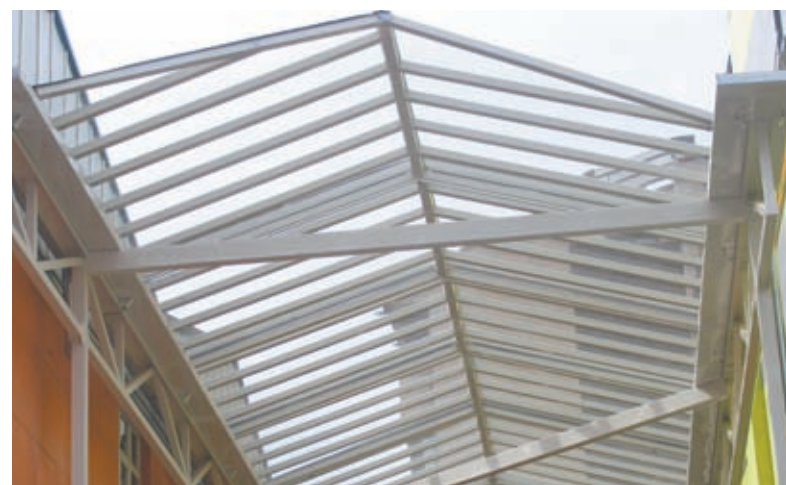
Vista general y con más detalle del nuevo sistema de cubrimiento del patio.