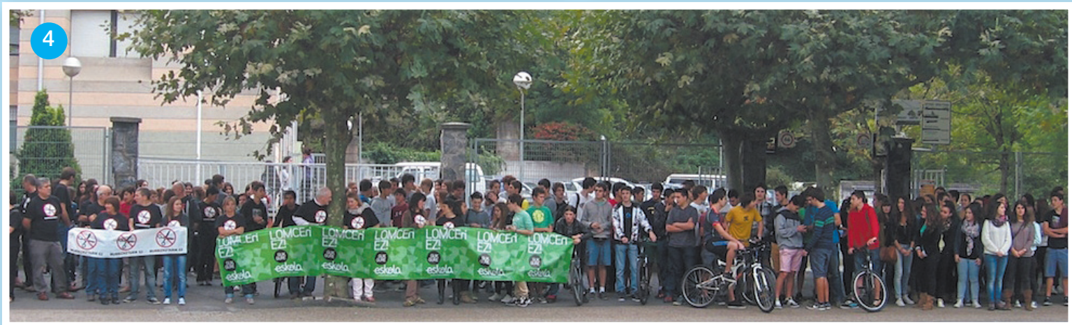
1. Urgain (Oñati). 2. Erniohea (Billabona). 3. Zuhaitzi (Donostia). 4. Ipintza (Bergara).