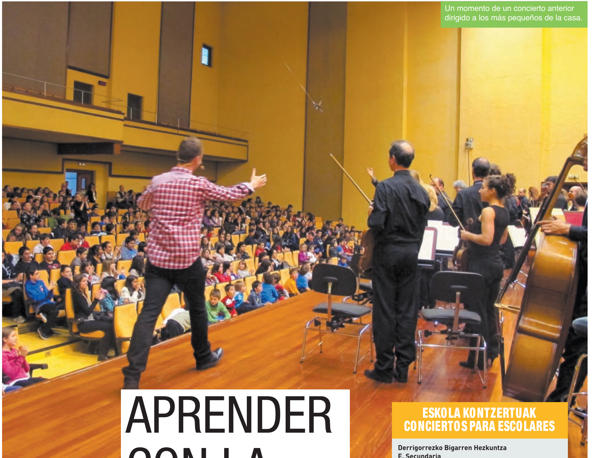
Un momento de un concierto anterior dirigido a los más pequeños de la casa.