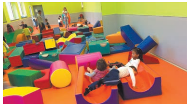
Los niños y niñas se lo pasan en grande en el aula de psicomotricidad.

Amaña ha sido el último centro escolar de Eibar en abrir este curso este tipo de equipamientos para el desarrollo psicomotor