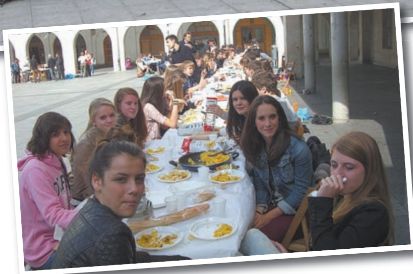
Kurtzebarriko Derrigorrezko Bigarren Hezkuntzako laugarren mailako ikasleek beren etxeetan hartu dituzte, zazpi egunez, Holandako Cujik herriko Merletcollege ikastetxeke 39 ikasle eta 3 irakasle. Argazkietan, batzuk eta besteak elkarrekin.