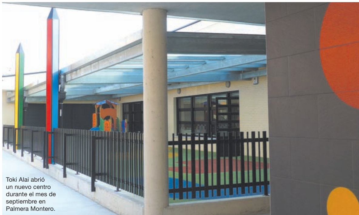
Toki Alai abrió un nuevo centro durante el mes de septiembre en Palmera Montero.

El equipo docente afirmaba en su momento que también era una ventaja muy grande el hecho de que los más pequeños estuvieran solos, separados de los de 3, 4 o 5 años porque "su mundo no tiene nada que ver, son unas edades en las que la diferencia de un año a otro es muy grande».