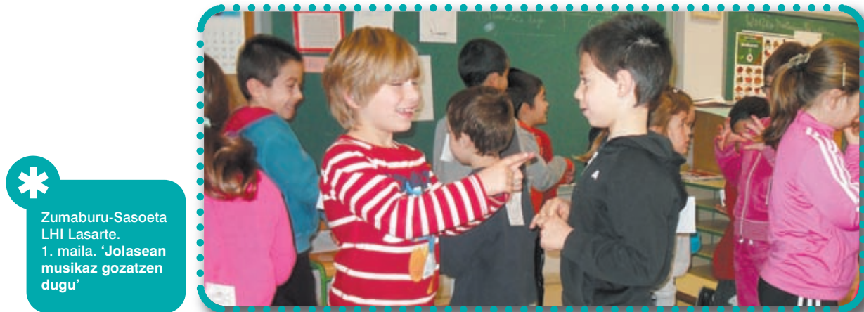
* Zumaburu-Sasoeta LHI Lasarte. 1. maila. 'Jolasean musikaz gozaten dugu'