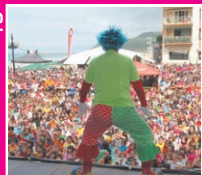
EUSKAL ESKOLA PUBLIKOAREN 22. JAIA