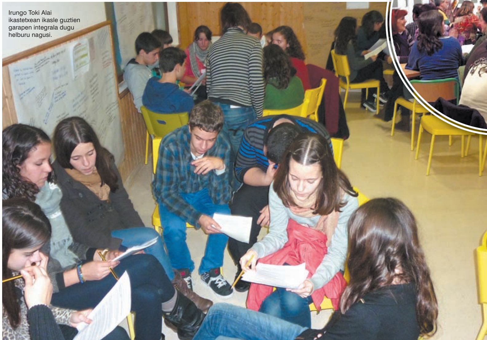
Irungo Toki Alai ikastetxean ikasle guztien garapen integrala dugu helburu nagusi.

Hau guztia bermatu ahal izateko, ikastetxearen antolaketa ere zaindu behar dugu: Dauzkagun baliabideak nahi dugun eskola honen zer-