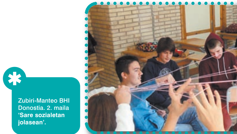
* Zubiri-Manteo BHI Donostia. 2. maila 'Sare sozialetan jolasean'.