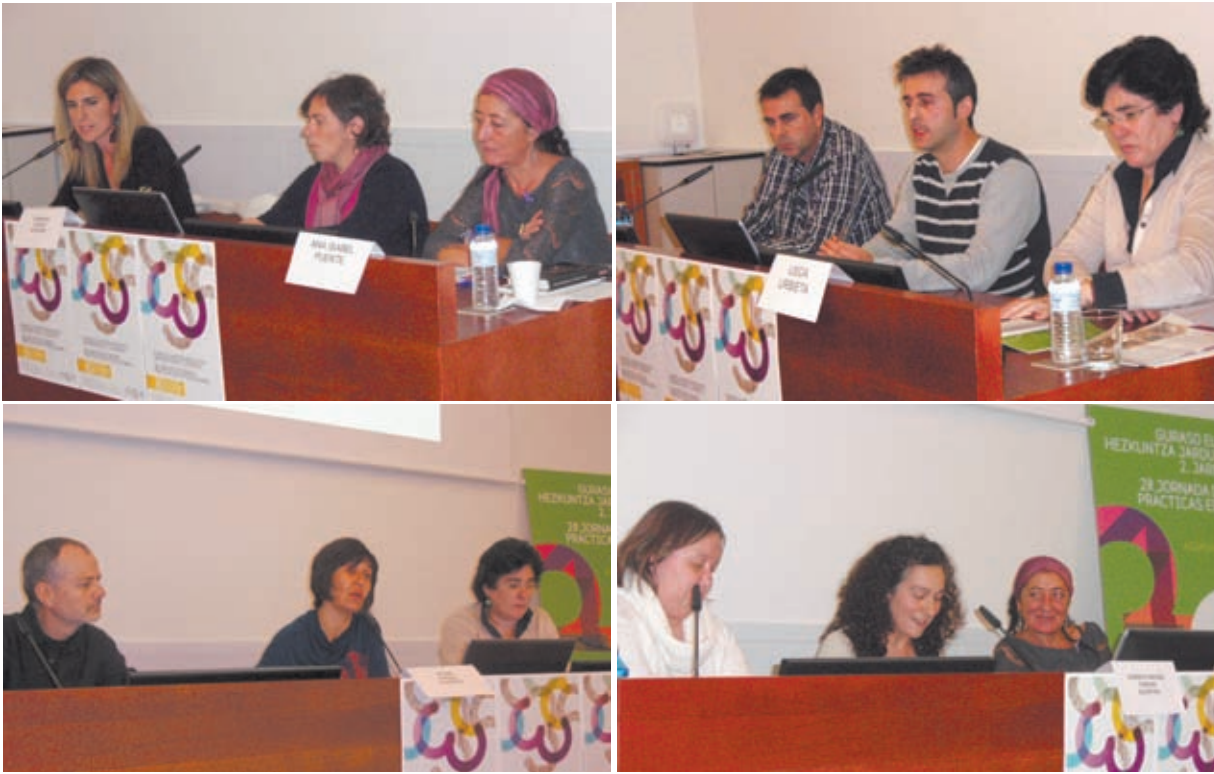
Esta nueva convocatoria del Concurso de Buenas Prácticas tiene como objetivo visibilizar la labor que realizan las AMPAs en los centros y promover el intercambio de experiencias.