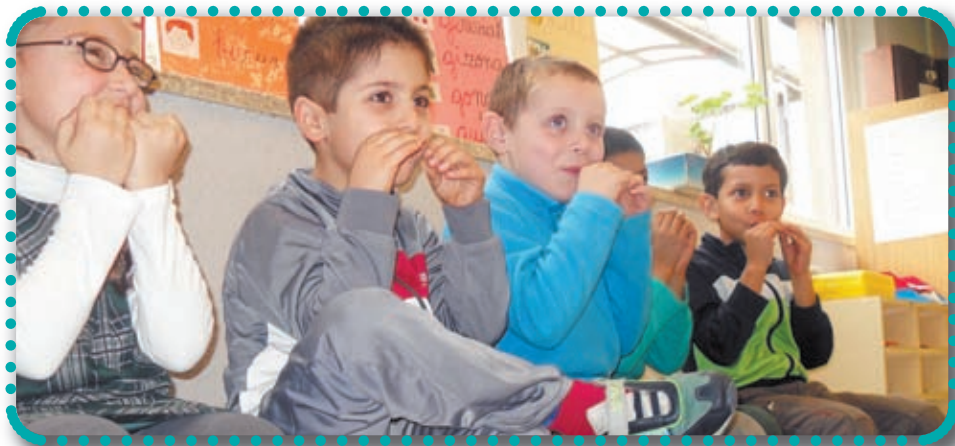
* Zumaburu-Sasoeta LHI Lasarte. 1. maila. 'Jolasean musikaz gozaten dugu'