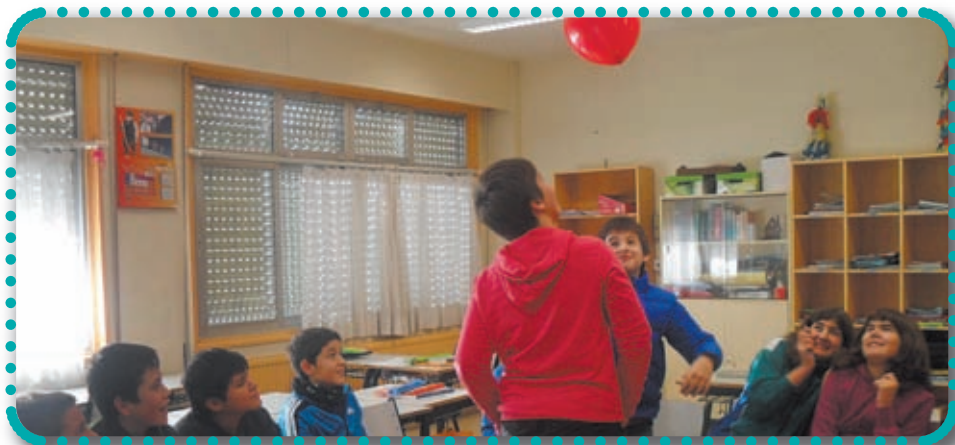
* Amasorrain LHI Donostia. 6. maila 'Sare sozialetan jolasean'