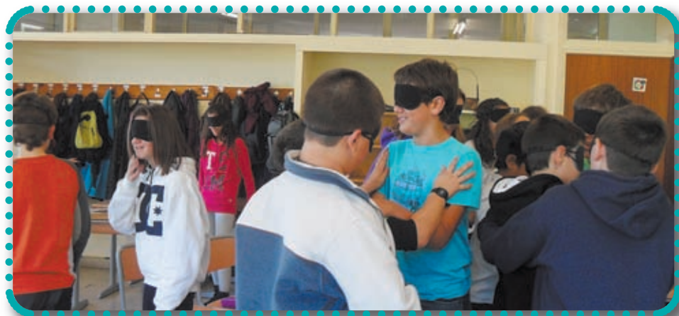
* Hernani BHI 1. maila 'Jolasean erabakiak hartzen ditugu'.