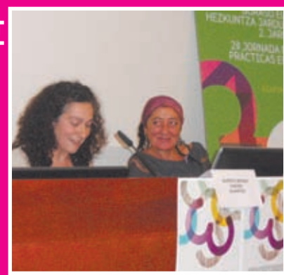
III CONCURSO DE BUENAS PRÁCTICAS DE AMPAS