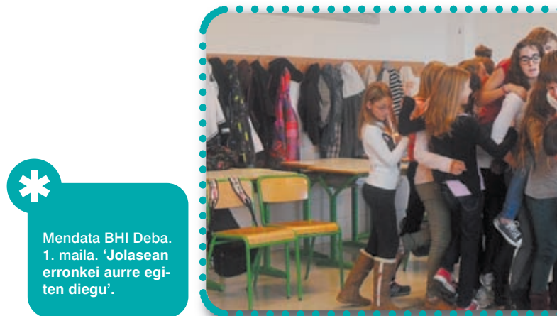
* Mendata BHI Deba. 1. maila. 'Jolasean erronkei aurre egiten diegu'.